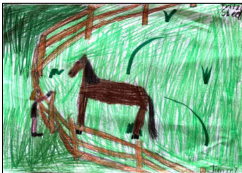
2. Platz Kinder: Fritzi Steeb