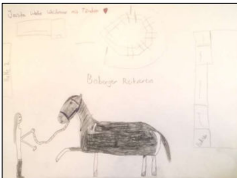
3. Platz Kinder: Janika Weidmann